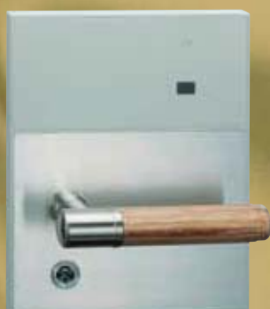
PRCU型ハンドル (水目桜・強化木)