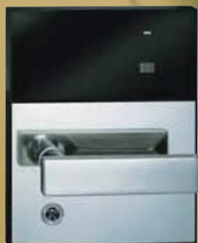
ORIU型ハンドル (ステンレス・ブライツ)