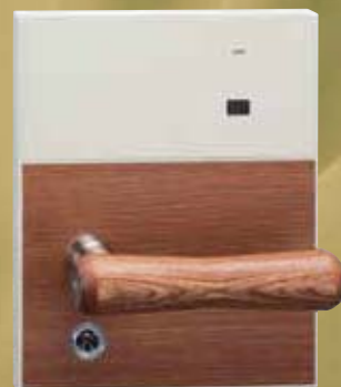
RNT型ハンドル (樺(かほ)・強化木)

(※写真のハンドルや座の仕上げは一例を示します。ハンドルのデザインや座の仕上げのバリエーションは豊富にあります。)