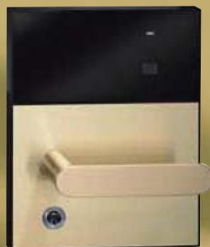
ZU型ハンドル (黄銅・ヘアライン)